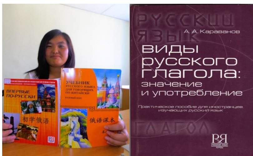
Рис. 1. Учебные пособия как лингвистический культурный стоппер

странцев в лесотехническом университете являются лингвистические стопперы (определяемые Л. Г. Копревой как «дискурсивные средства воздействия») – «специфические лингвопсихологические средства воздействия», обнаруженные в диалогах-стопперах при адаптационных неучебных и учебно-дидактических речевых ситуациях со студентами из ближнего и дальнего зарубежья [4, 5]. Так, показательными моделирующими актами в этом смысле могут быть фрагменты семинарских занятий (включая учебно-справочный материал) и выездные (дистанционные) мероприятия, не исключая разновозрастные группы (локальные этностопперы), в которых принимают участие студенты Уральского государственного лесотехнического университета, приезжающие из Китая по программе включенного обучения (рис. 1–3).