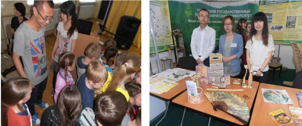
Рис. 3. Выездные мероприятия (этностоперы)

Представляется, что более углубленно использовать стопперы могут преподаватель и студент, участвуя в актуальном тематическом диалоге (по конкретному заданию). Например, при отработке навыка говорения (включая лексико-грамматические характеристики). Используем фрагмент задания 1. Определите возможные ответы, завершая следующие предложения: