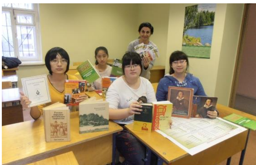
Рис. 2. Учебные занятия как лингвистический культурный стоппер