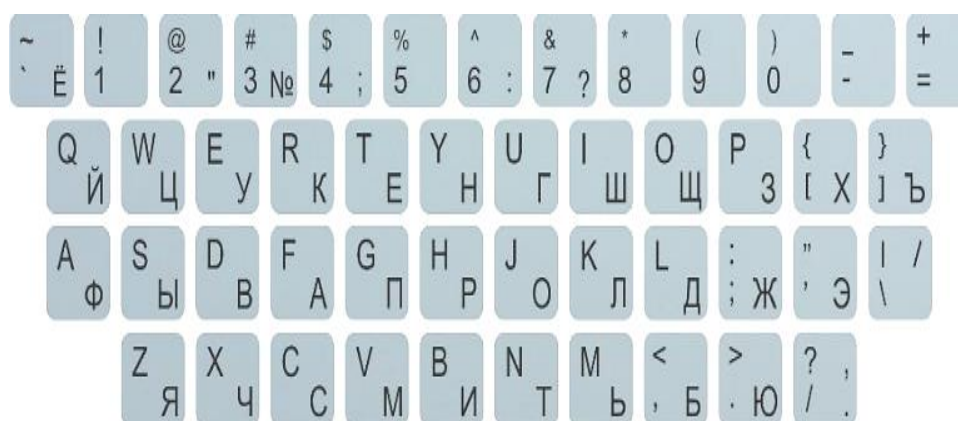
Рис. 1. Раскладка «ЙЦУКЕН»

Эксперимент проводился на клавиатуре со стандартной раскладкой «ЙЦУКЕН» (рис. 1). Одна из особенностей «слепого» набора текста десятипальцевым методом заключается в развитии не зрительной, а мышечной памяти.