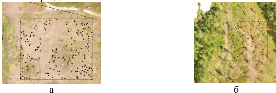
Рисунок 7.4 – Определение количества пней на вырубках

При подготовке проектов лесовосстановления и создании лесных культур важно располагать данными о количестве пней на 1 га и качестве подготовки почвы. Для оценки возможности использования для получения таких данных БЛА на двух вырубках заложены пробные площади, границы которых перенесены на ортофотопланы. Результаты исследований позволяют констатировать, что разрешение ортофотоснимков позволяет с точностью, достаточной для подготовки проекта лесовосстановления, определить количество пней на участке рубки (рис. 7.4), оценить соответствие проекту процента обработанной площади, расстояний между бороздами, направлений и качества подготовки борозд.