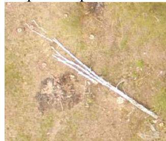
Рисунок 7.2 – Ортофотопланы вырубке, расположенной в квартале 28 Березовского участка Березовского лесничества

На третьем этапе выполнены исследования о возможности использования БЛА при контроле за соблюдением схемы разработки лесосеки. Ортофотопланы вырубок сопоставлялись с соответствующими схемами разработки лесосек (рис. 7.3). Установлено, что они позволяют корректно определить фактическое расположение волоков и погрузочных площадок, их соответствие технологическим картам, выявить нарушения схемы разработки лесосек, в частности заезды трелевочного трактора в пасеки.