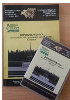
Деревообработка: технологии, оборудование, менеджмент XXI века

В книгу трудов включены доклады XII Международного евразийского симпозиума «Деревообработка: технологии, оборудование, менеджмент XXI века». В трудах рассмотрены актуальные вопросы: теории и практики организации деревообрабатывающего производства; эффективности использования инновационных и информационных технологий в фундаментальных научных и прикладных исследованиях, образовательных и коммуникативных системах и средах; технологии подготовки круглых лесоматериалов и их переработки с получением пиломатериалов; деревянного домостроения и отделки изделий из древесины лакокрасочными материалами; теории резания древесины, расчета режимов резания древесины на станках, совершенствования и проектирования принципиально нового технологического деревообрабатывающего оборудования и режущего инструмента, повышения их точности и надежности; экологии и безопасности и др.