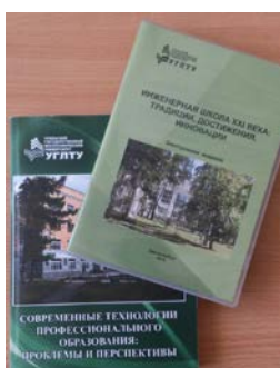
Материалы научно-методической конференции

Требования к оформлению, архив номеров - http://symposium.forest.ru