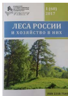
журнал «Леса России и хозяйство в них»

Представляемые статьи должны содержать результаты научных исследований, которые можно использовать в практической работе специалистов лесного хозяйства, лесопромышленного комплекса и смежных с ними отраслей (экономики и организации лесопользования, лесного машиностроения, охраны окружающей среды и экологии), либо они должны представлять познавательный интерес (исторические материалы, краеведение и др.).