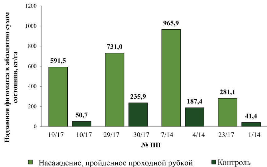
Рис. 1. Надземная фитомасса черники обыкновенной в абсолютно сухом состоянии, кг/га

Интересно отметить тот факт, что в живом напочвенном покрове изучаемых насаждений, где не проводилась проходная рубка, запасы черники обыкновенной незначительны и не имеют эксплуатационного значения. При этом, согласно данным, представленным в предыдущих наших работах [17, 18], спелые