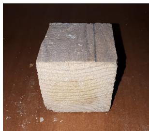
Рис. 5. Образец № 5 пропитка с жидким стеклом Fig. 5. Sample № 5 impregnation with liquid glass

пропитывается заготовка № 5 в 2 слоя, время про- сыхания между слоями 12 ч (рис. 5). Расход 1 л смеси на 1,5 м 2 .