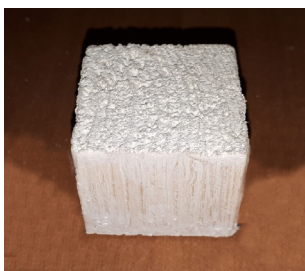
Рис. 2. Образец № 2 суперфосфат с водой 40/60 Fig. 2. Sample № 2 superphosphate with water 40/60

2. Смешивается удобрение суперфосфата до перенасыщенного состояния в воде. Полученный состав наносится на заготовку № 2 (рис. 2). После нанесения первый слой подвергается сушке в течение 12 ч, затем наносится второй слой.