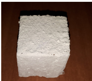
Рис. 1. Образец № 1 суперфосфат с водой 70/30 Fig.1. Sample № 1 superphosphate with water 70/30

1. Смешивается удобрение суперфосфата с водой в соотношении 70:30, полученным составом обмазывается образец № 1, покрытие двухслойное (рис. 1). После сушки первого слоя в течение суток наносится второй слой. Расход смеси составляет около 1,5 кг на 1 м 2 поверхности образца.