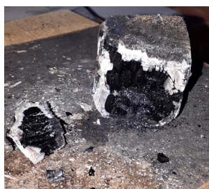
Рис. 11. Образец № 5 пропитка с жидким стеклом Fig. 11. Sample № 5 impregnation with liquid glass

Образец № 5 (рис. 11) начал обугливаться почти через 2 мин, а тление началось после двух минут, данный образец полностью выгорел через 11,5 мин. Устойчивость к огню высокая. При тлении присутствовал едкий запах.