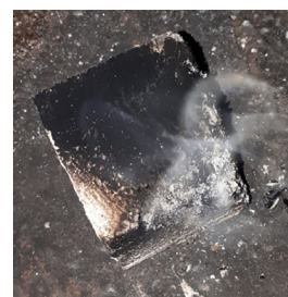
Рис. 8. Образец № 2 суперфосфат с водой 40/60 Fig. 8. Sample № 2 superphosphate with water 40/60

Образец № 2 (рис. 8) начал обугливаться поч- ти через 1,5 мин, а тление началось после 2,5 мин, данный образец загорелся через 11 мин, таким об- разом, он наиболее устойчив к огню.