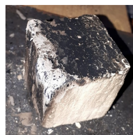
Рис. 9. Образец № 3 известково-глиняно-солевая обмазка Fig. 9. Sample № 3 lime-clay-salt coating

Образец № 3 (рис. 9) начал обугливаться меньше чем через 40 с, а тление началось в 1,4 мин, загорелся через 6 мин, устойчивость к огню средняя.