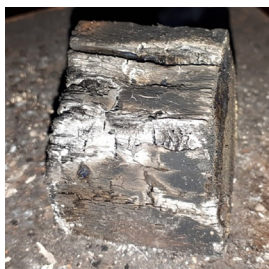
Рис. 10. Образец № 4 пропитка с борной кислотой и содой Fig. 10. Sample № 4 impregnation with boric acid and soda

Образец № 4 (рис. 10) начал обугливаться через 30 с, а тление началось в 1,58 мин, загорелся через 7 мин, устойчивость к огню средняя.