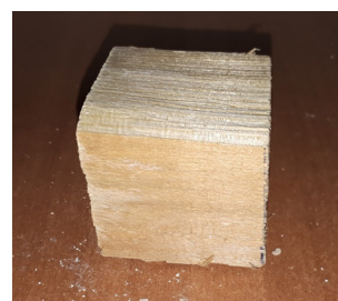
Рис. 4. Образец № 4 пропитка с борной кислотой и содой Fig. 4. Sample № 4 impregnation with boric acid and soda

4. Пропитка на водной основе с кальцинированной содой и борной кислотой. Для получения кальцинированной соды берется пищевая сода и прокаливается на сковороде при температуре 200 °С до прекращения выделения паров воды и диоксида углерода CO 2 . В емкости 1 л воды смешивается с борной кислотой и добавляется кальцинированная сода. Полученным составом обмазывается заготовка № 4 за 2 раза (рис. 4). После нанесения первого слоя образец сохнет в течение 12 ч.