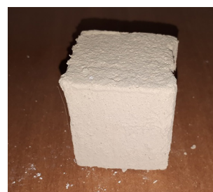
Рис. 3. Образец № 3 известково-глиняносолевая обмазка Fig. 3. Sample № 3 lime-clay-salt coating

смешивают между собой, соблюдая пропорцию между количеством извести, глины и соли соответственно 75:15:10 (Газизов и др., 2018а; 2018б). Полученным составом обмазывается образец № 3 с помощью жесткой кисти 2 раза (рис. 3). После нанесения первого слоя подвергается сушке в течение 12 ч, расход смеси на двухслойную обмазку составляет 1,5 кг на 1 м 2 . Цвет высохшей заготовки светло-коричневый.