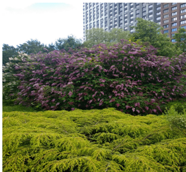
Рис. 1. Коллекция сирени мохнатой в Ботаническом саду УрО РАН Fig. 1. Collection of shaggy Syringa in the Botanical Garden of the Ural Branch of the Russian Academy of Sciences

получить формы с махровыми цветками, расширить их колористическую гамму, сделать более продолжительным цветение, а также получить низкорослые формы (Окунева, 2008; Полякова и др., 2010).