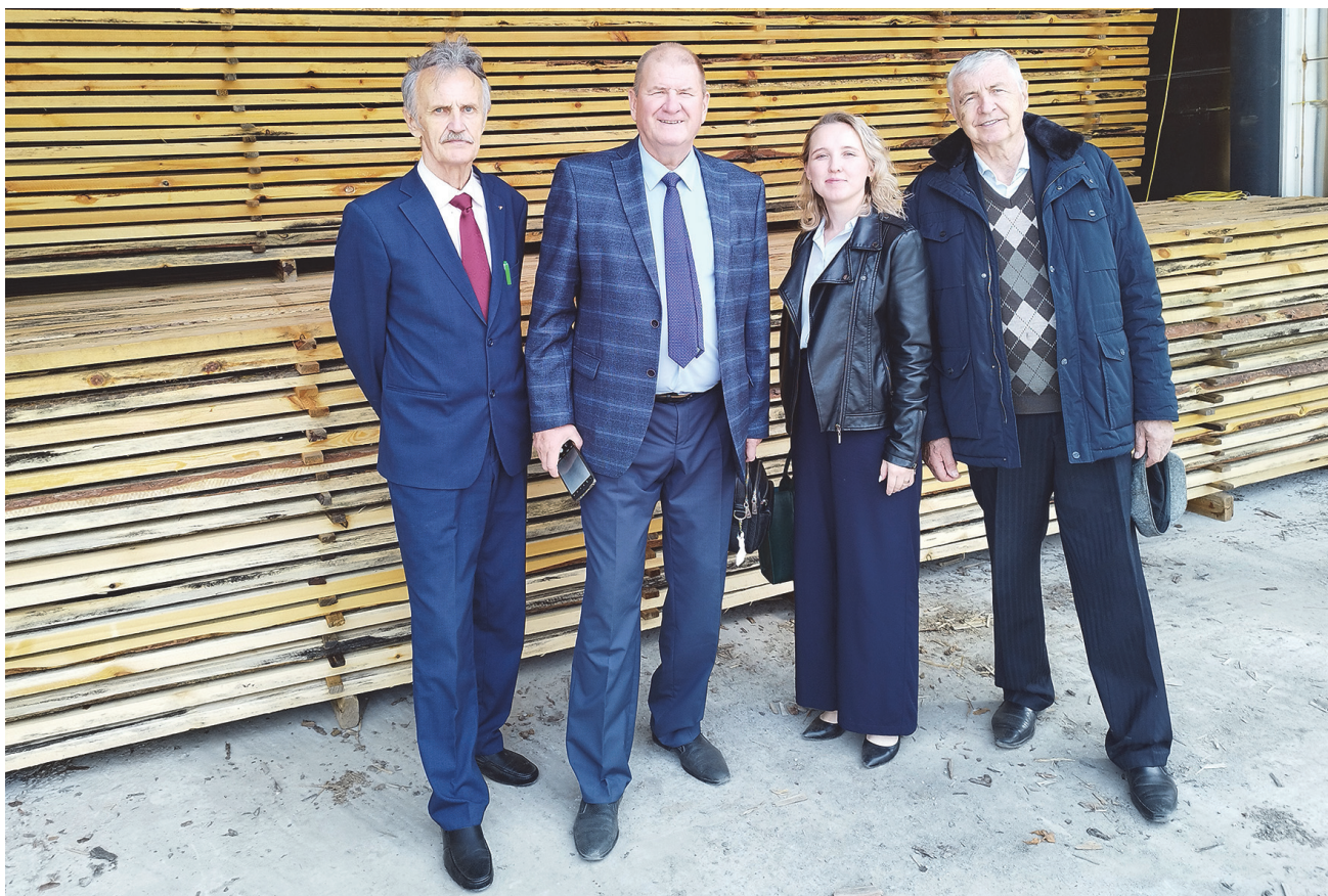
С коллегами на производственном участке предприятия ООО «Режевской леспромхоз».

В 1996 году организовал и руководил двухнедельной ознакомительной практикой группы студентов лесоинженерного факультета в Германии. Выезжал на зарубежные стажировки в Институт снега, леса и ландшафта (Швейцария) и Департамент леса и окружающей среды (Лихтенштейн). В 1992 году был назван лучшим ассистентом УЛТИ, неоднократно отмечался приказами по вузу за большую работу по обучению и воспитанию студенческой молодежи.