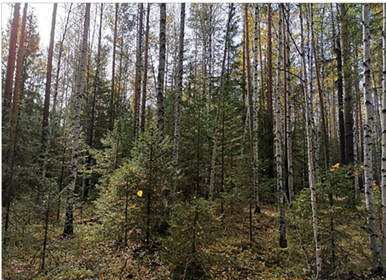
Рис. 1. Второй ярус древостоя с преобладанием ели сибирской (ПП 2) Fig. 1. The second layer of the forest stand with a predominance of Siberian spruce (trial plot 2)