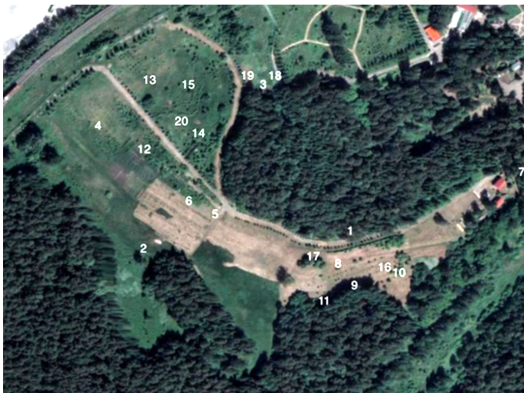
Рис. 1. Схема расположения почвенных разрезов Fig. 1. Scheme of the location of soil sections