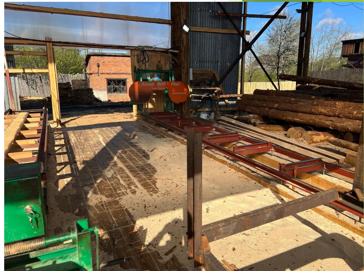
Ленточное лесопиление Алтай 900