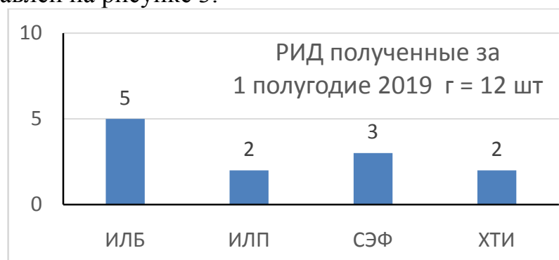
Рис. 3. Вклад структурных подразделений в создание РИДов

Вклад структурных подразделений ВУЗа в формирование отчетных цифр по результатам интеллектуальной деятельности (РИД) полученным в 2019 г представлен на рисунке 3.