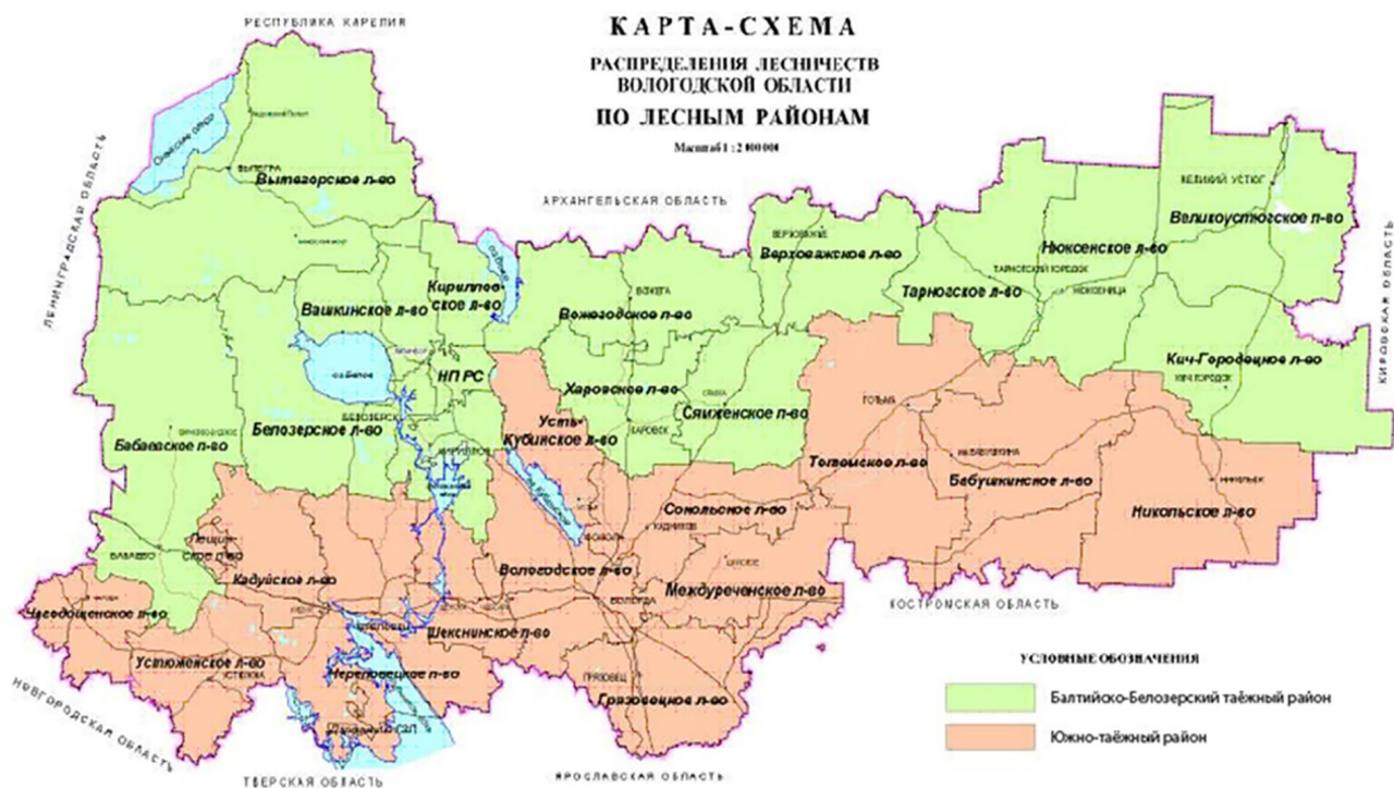
Рис. 1. Схема распределения лесничеств Вологодской области по лесным районам Fig. 1. The scheme of distribution of forest areas of the Vologda region by forest areas

Общая площадь лесного фонда на 01.01.2021 г. составляет 11471,7 тыс. га, в том числе площадь лесных земель 10 140,2 тыс. га при 9730,1 тыс. га земель, на которых расположены леса (табл. 1).