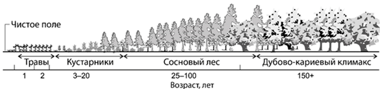
Рис. 2. Схема растительной сукцессии на землях, вышедших из-под сельскохозяйственного оборота в Пьемонте, США [104]

Составление таблиц хода роста методом «указательных» насаждений. В лесной таксации типичным примером подобного