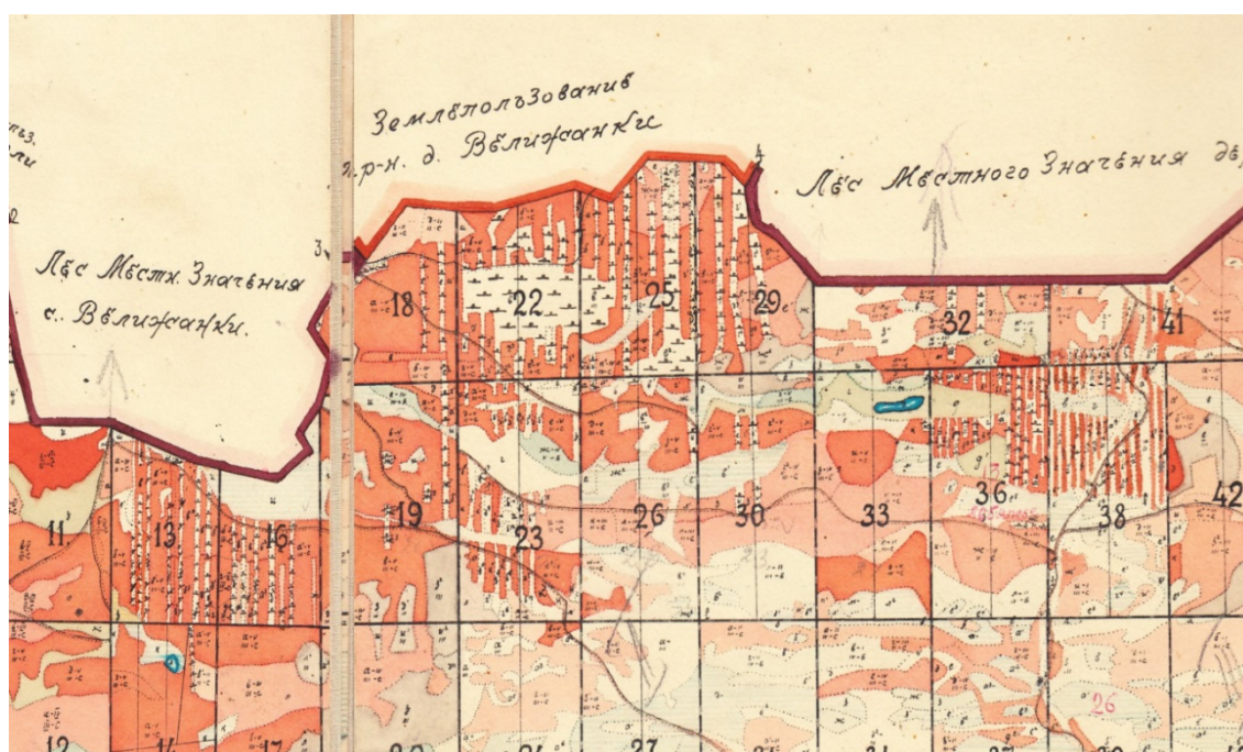
Рис. 2 - Фрагмент плана лесонасаждений с чересполосными постепенными рубками, выполненными с 1900 по 1930 гг.

Несмотря на то, что чересполосные постепенные рубки в научной литературе впервые были описаны в 1958 г. П.В. Алексеевым (Алексеев, 1967; Тихонов, 2005) в ленточных борах Алтайского края их аналоги применялись с начала XX века, о чем свидетельствует фрагмент плана лесонасаждений Панкрушихинского лесничества 1938 г. (рис. 2).