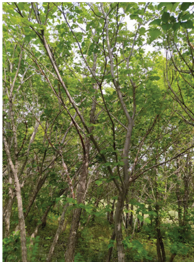
Рис. 3. Вязовое насаждение без рубки ухода Fig. 3. Elm stand without thinning