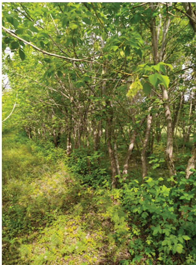
Рис. 2. Внешний вид искусственных вязовых насаждений, пройденных рубками ухода Fig. 2. Appearance of artificial elm plantations, thinned