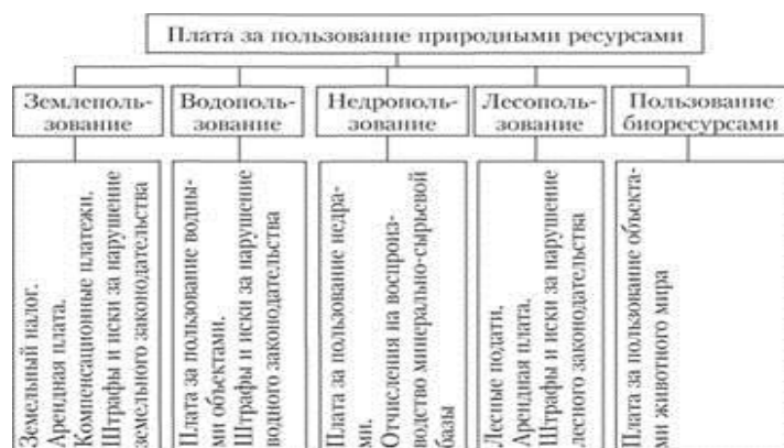
Рис. 10.8. Структура платы за природные ресурсы

Формами платы за землю являются: арендная плата, земельный налог. Размер арендной платы за землю устанавливается договором. Размер земельного налога не зависит от результатов хозяйственной деятельности и устанавливается в виде стабильных платежей за единицу земельной площади в расчете на год. При формировании бюджетной системы РФ производится регулярный пересчет земельного налога с учетом индексации ставок. Ставки земельного налога определяются отдельно по категориям земель основного целевого назначения, видам и подвидам угодий, природным зонам, группам почв, городам, поселкам, зонам крупных населенных пунктов.